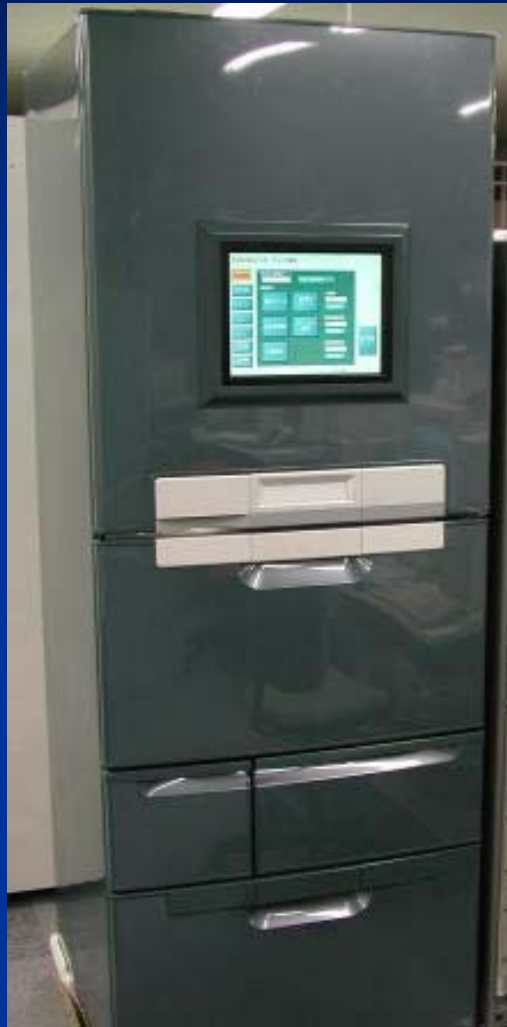
Toshiba Internet Refrigerator